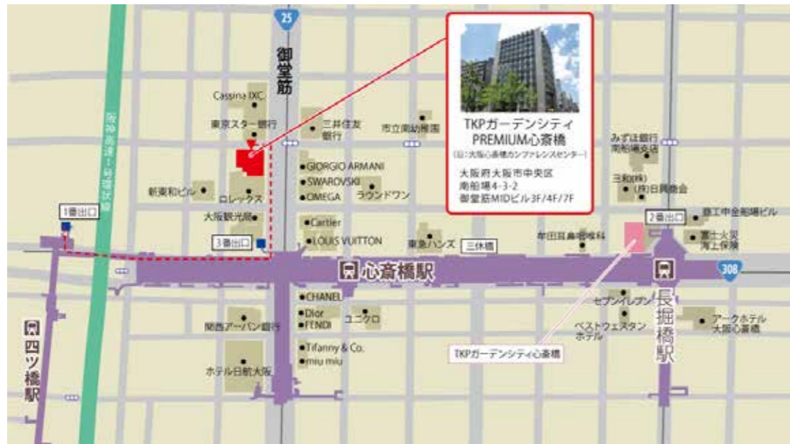
●大阪市営地下鉄御堂筋線 心齋橋駅 3番出口 徒歩2分

TKP ガーデンシティ PREMIUM 心齋橋 7F 大阪府大阪市中央区南船場 4-3-2 御堂筋 MID ビル 7F TEL: 06-4400-5262